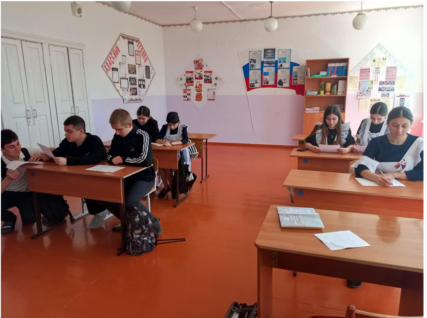
Анкетирование - опросник «Охрана труда глазами детей».